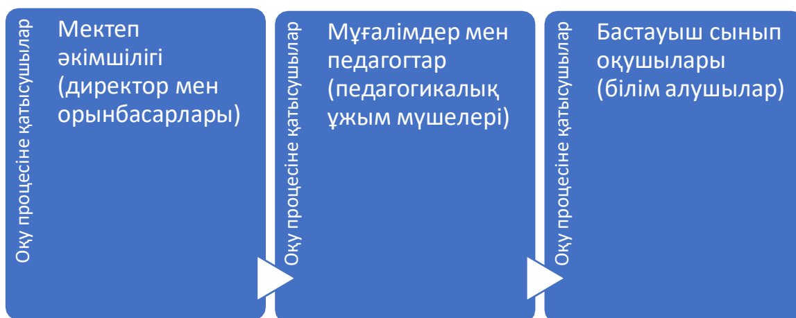
Сурет-1. Бастауыш білім беру жүйесіндегі оқу процесіне қатысушы тараптар

барлық қатысушыларының құқықтары мен мәртебесі тең атты концепция. Аталмыш концепция бойынша мектептегі түрлі процестерді ұйымдастыру жүйесінде үш басты қатысушылар бар (сурет-1). Ол қатысушылар оқу процесінде өзара қарым-қатынасында бұйрық беру мен қадағалау стильдеріне негізделген коммуникация орнатпай, ортақ мәмілеге келу, диалог құру іспеттес демократиялық қарым-қатынас формаларын қолдану ұсынылады.